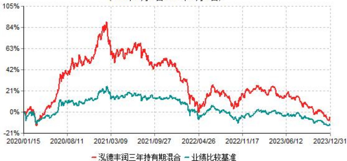
泓德丰润三年持有期混合型证券投资基金累计净值增长率与业绩比较基准收益率历史走势对比图 (2020年01月15日-2023年12月31日)

注：根据基金合同的约定，本基金建仓期为6个月，截至报告期末，本基金的各项投资比例符合基金合同关于投资范围及投资限制规定。