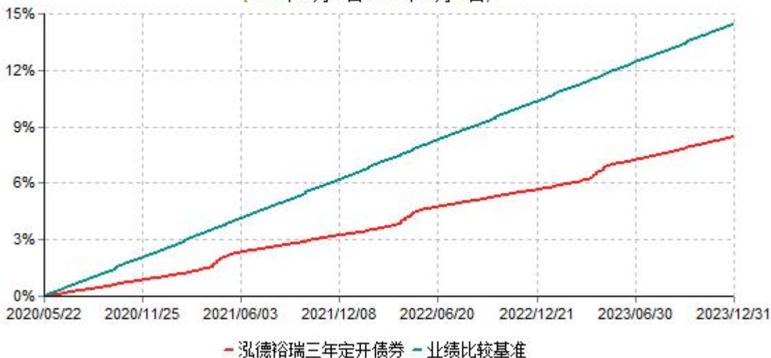
泓德裕瑞三年定期开放债券型发起式证券投资基金累计净值增长率与业绩比较基准收益率历史走势对比图 (2020年05月22日-2023年12月31日)

注：根据基金合同的约定，本基金建仓期为6个月，截至报告期末，本基金的各项投资比例符合基金合同关于投资范围及投资限制规定。